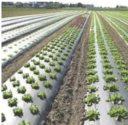
FIGURA 3. Película de plástico de acolchado agrícola. Película de acolchado perforada para el control de malezas

S. Sánchez-Valdés et al // Nanocompuestos de poliolefinas utilizados en la fabricación... 109-116 P(MMA-co-MAA). Entre los aceites y esencias cargados en las NPs destacan los de lavanda, canela, jazmín, eucalipto y citronela. Las aplicaciones fueron realizadas en películas para acolchado. Los resultados mostrados indican que es factible el desarrollo de películas para acolchado conteniendo NP cargadas con aceites esenciales o esencias para repeler insectos en cultivos agrícolas diversos (Figura 3) (Saade; et al, 2021).