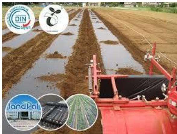
Figura 1. Película agrícola a base de PBAT100% biodegradable.

S. Sánchez-Valdés et al // Nanocompuestos de poliolefinas utilizados en la fabricación... 109-116 arroz, donde han demostrado ser eficaces para superar el estrés abiótico. El polietileno también es económico y puede ser reciclado, lo que lo convierte en una opción atractiva para los agricultores (Subrahmaniyan, 2012).